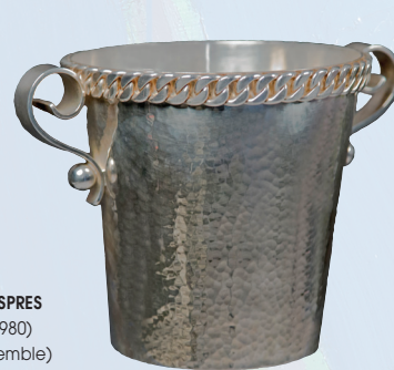
JEAN DESPRES (1889-1980) (d'un ensemble)