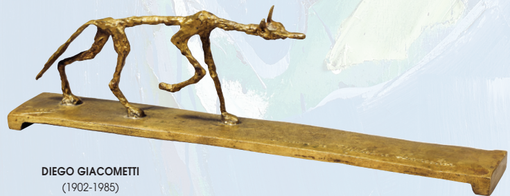
DIEGO GIACOMETTI (1902-1985)